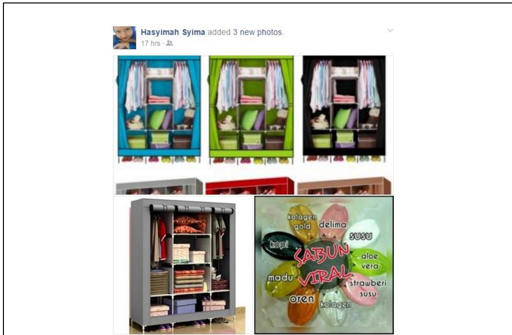
Caption : Antara produk-produk lain yang turut diniagakan

iv) Lain-lain (contoh : proses penghasilan produk, penglibatan dalam aktiviti lain, dsb)