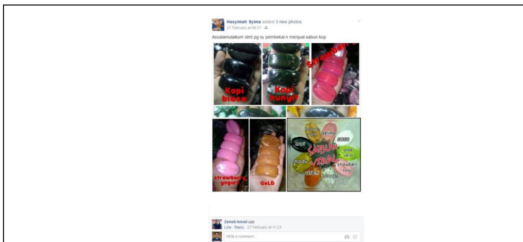
Caption : Juga menjual pelbagai produk di FB

iv) Lain-lain (contoh : proses penghasilan produk, penglibatan dalam aktiviti lain, dsb)